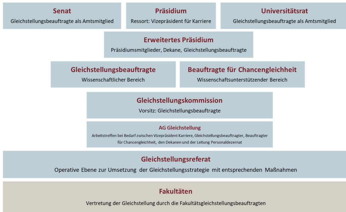
Abbildung 1: Organigramm der Strukturen zur Förderung der Gleichstellung und Chancengleichheit an der Universität Ulm

Die Gleichstellungsarbeit an der Universität Ulm orientiert sich an der im Mission Statement Gleichstellung festgeschriebenen Gleichstellungsstrategie und ist über das in Abbildung 16 dargestellte Organigramm in die Leitungsstrukturen der Universität fest eingebunden.